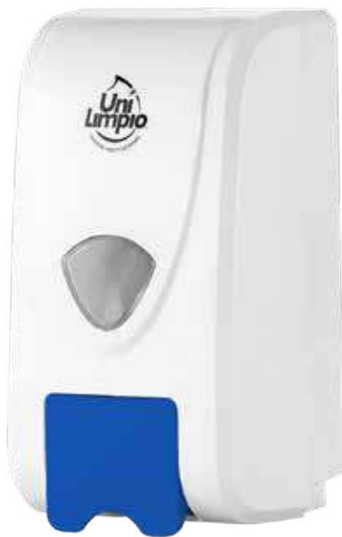
Cambio color de Push Change the color of the handle